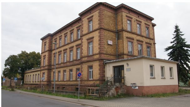
MHL 2498 Nordhausen Reichsbahnamt 11